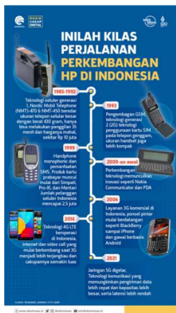
Gambar 1. Perkembangan Teknologi Komunikasi di Indonesia

Sejalan dengan revolusi digital ini, industri food and beverage (F&B) juga mengalami transformasi signifikan. Data dari Badan Pusat Statistik menunjukkan pertumbuhan industri F&B sebesar 4,62% pada kuartal 2 tahun 2023, menandakan resiliensi dan adaptabilitas sektor ini terhadap perubahan pasar. Salah satu fenomena yang menonjol dalam industri ini adalah munculnya tren coffee shop , yang tidak hanya menjual kopi tetapi juga menawarkan pengalaman dan gaya hidup.