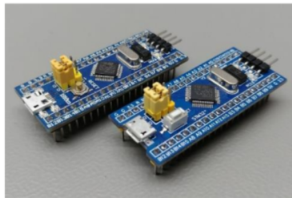
Gambar 1. STM32

Mikrokontroler 32 – bit dengan inti prosesor ARM32-bit produksi dari perusahaan STMicroelectronics disebut dengan STM32. STM32 digunakan dapat digunakan pada berbagai aplikasi elektronik. Kelebihan dari mikrokontroler ini adalah memiliki kinerja dan efisiensi tinggi.