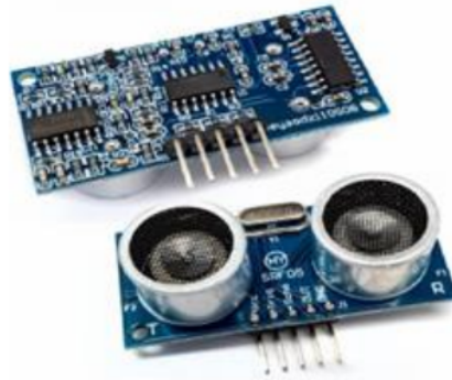
Gambar 2. HY-SRF05