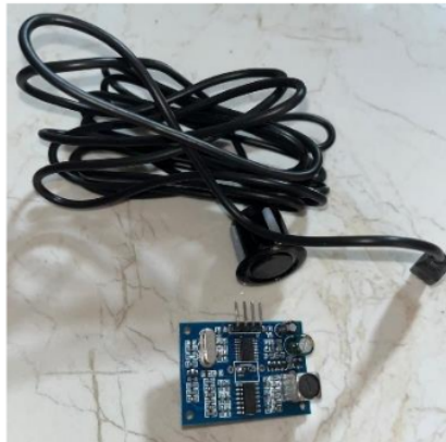
Gambar 3. JSN-SR04T

JSN-SR04T merupakan sensor ultrasonik untuk mengukur jarak dengan mengirimkan gelombang ultrasonik dan menghitung waktu pantulnya sama dengan sensor HY-SRF05. Selain memiliki fitur water resist, sensor ini memiliki jangkauan pengukurann yang lebih luas dibandingkan dengan beberapa sensor lainnya. Sensor ini sering digunakan sebagai sensor parkir karena kelebihanannya yang aman ketika terkena hujan.