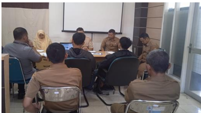
Gambar 2. Diskusi antara tim pengabdian, pihak pelaksana dan pihak terkait