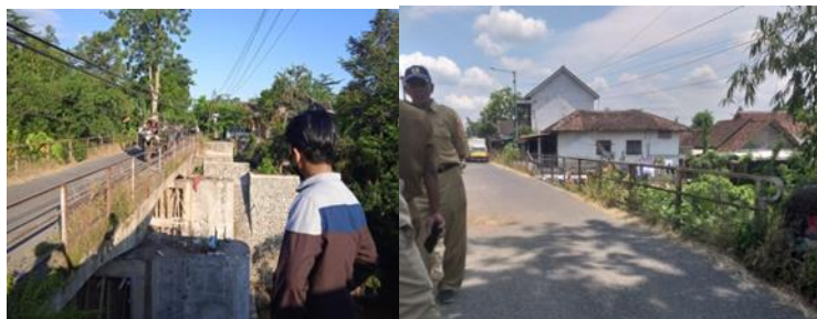
Gambar 3. Survey lapangan mengenai kondisi pembangunan jembatan