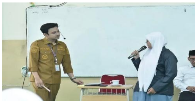
Gambar 4. Kegiatan Seminar Yang Menjadi Sarana Komunikasi Antara Wakil Wali Kota dan Generasi Muda.