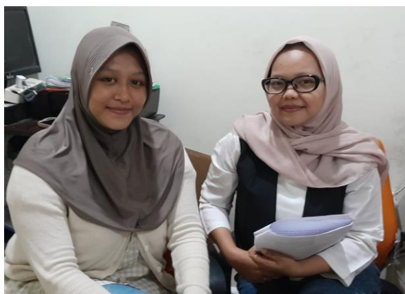
Gambar 3. Sesi Wawancara Dengan Informan II.