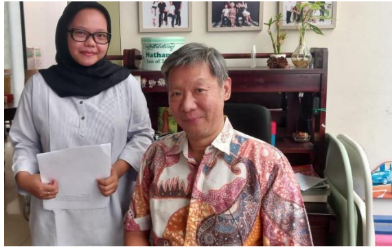
Gambar 1. Sesi Wawancara Dengan Key Informan.

Berdasarkan hasil wawancara yang dilakukan pada tanggal 30–31 Desember 2025, peneliti memperoleh informasi mengenai disiplin kerja dan kinerja karyawan di perusahaan. Dari hasil wawancara terkait tingkat kehadiran karyawan, diketahui bahwa setiap bagian memiliki pola kehadiran yang berbeda sesuai tugas dan tanggung jawab masing-masing.