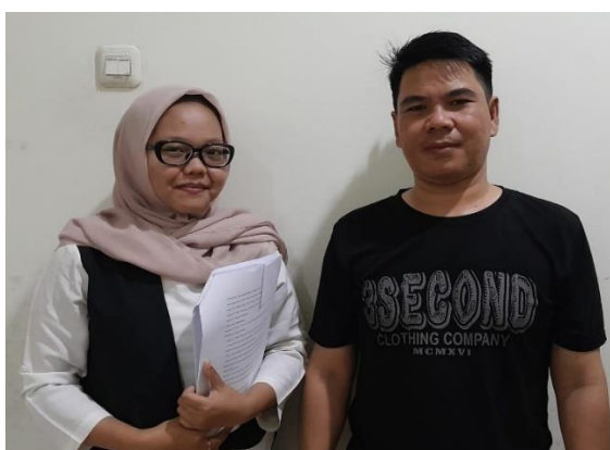
Gambar 4.4 Sesi Wawancara Dengan Informan III

Pada hasil wawancara mengenai sikap perusahaan terhadap pelanggaran aturan kerja, diketahui bahwa perusahaan menerapkan tindakan yang tegas namun tetap mempertimbangkan kondisi tertentu. Pelanggaran ringan seperti keterlambatan masih dapat diberikan toleransi, namun pelanggaran berat seperti pencurian atau penipuan akan diberikan sanksi tegas hingga pemecatan. Sikap tegas perusahaan dinilai penting untuk menjaga disiplin kerja, meningkatkan tanggung jawab karyawan, serta menjaga kualitas pelayanan kepada pelanggan.