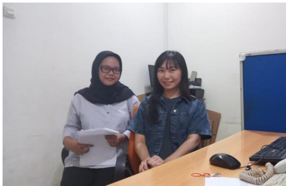
Gambar 2. Sesi Wawancara Dengan Informan I.

Direktur tidak hadir setiap hari karena pengawasan dapat dilakukan melalui komunikasi jarak jauh dan koordinasi secara online. Sementara itu, bagian marketing hadir setiap hari untuk menjaga hubungan dengan mitra dan memastikan target perusahaan tercapai. Bagian call center bekerja sesuai jadwal shift untuk melayani pelanggan, menangani keluhan, dan memastikan kepuasan konsumen. Sedangkan kurir hadir setiap hari karena memiliki tanggung jawab dalam pengiriman makanan secara tepat waktu.