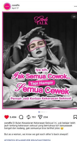
Gambar 7. Unggahan edukasi kekerasan seksual pada akun @condfe

Analisis pada kolom komentar menunjukkan adanya praktik counter-discourse yang signifikan. Sebagai contoh, interaksi pada unggahan 22 Maret 2026 memperlihatkan bagaimana audiens menggunakan ruang ini untuk melawan stigma negatif tubuh perempuan. Komentar dari pengguna @faexiiry yang membandingkan @condfe dengan platform lain yang sering melakukan objektifikasi, seperti penggunaan istilah body shaming , menunjukkan bahwa @condfe telah berhasil membangun ‘benteng emosional’. Di sini, Relationship Management tidak hanya terjadi antara brand dan audiens , tetapi berubah menjadi interaksi horizontal antar-audiens yang saling memvalidasi, sehingga menciptakan ruang aman yang aktif dan organik.