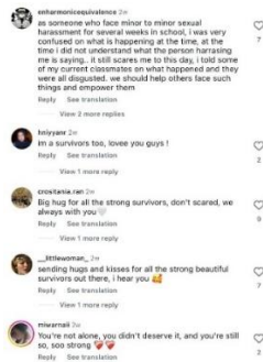
Gambar 1. Komentar audiens @condfe tentang pengalaman kekerasan seksual