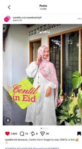
Gambar 5. Unggahan pada Instagram @condfe yang menunjukkan gaya berpakaian perempuan saat Hari Raya Idulfitri

Pola komunikasi di kolom komentar @condfe dalam unggahannya pada 22 Maret 2026, seperti praktik saling memuji dan pemberian dukungan emosional, mencerminkan praktik girls support girls yang nyata. Praktik saling memuji berfungsi sebagai upaya kolektif dalam mendefinisikan ulang standar kecantikan yang lebih inklusif. Solidaritas digital sisterhood yang terbentuk secara aktif menciptakan ruang aman, di mana perempuan merasa aman untuk mengekspresikan diri tanpa takut dihakimi oleh standar sosial yang mengekang.