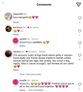
Gambar 6. Isi komentar perempuan saling memuji pada unggahan Instagram @condfe