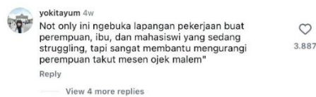
Gambar 2. Komentar audiens @condfe tentang perempuan menjadi pengemudi ojek online