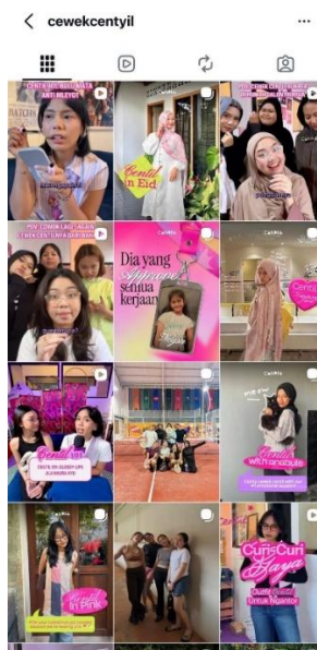
Gambar 4. Unggahan Instagram @cewekcentyil berisikan potret perempuan ‘centil’