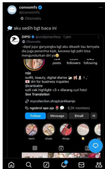
Gambar 1. Framing Berita Media Sosial X

Dalam laporan yang di terbitkan oleh media sosial X, Framing ketidakadilan dan ketidaksetaraan, banyak pihak yang menyoroti ketidakadilan dan ketimpangan dalam kasus ini. CMJ, yang dirasa berasal dari keluarga mampu, telah menggunakan bantuan KIP Kuliah yang seharusnya diperuntukkan bagi mahasiswa kurang mampu. Framing ini memicu kemarahan dan kekecewaan publik terhadap CMJ dan sistem seleksi KIP Kuliah yang dianggap tidak akurat.