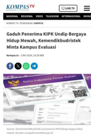
Gambar 2. Framing Berita Kompas.TV

Framing Sistem yang Bermasalah Kasus CMJ juga memunculkan kritik terhadap sistem seleksi KIP Kuliah yang dianggap memiliki celah dan mudah dimanipulasi. Framing ini mendorong evaluasi dan perbaikan sistem KIP Kuliah agar lebih selektif dan tepat sasaran.