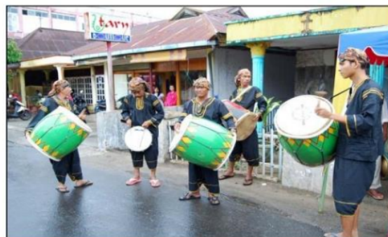
Gambar 3.21 Ensambel Gandang Tasa

Selama ritual Tabuik, Ensambel Gandang Tasa dimainkan oleh 6 hingga 7 orang pemain, terdiri dari 6 pemain Gandang dan 1 pemain Tasa. Posisi instrumen Gandang Tasa disandang di bahu para pemain, karena instrumen ini digunakan untuk mengiringi arak-arakan dalam ritual Tabuik. Gandang Tasa dimainkan secara bergantian oleh para remaja, mengingat jarak yang ditempuh selama arak-arakan cukup jauh, yaitu sekitar 1 hingga 2 kilometer.