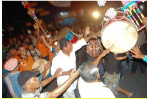
Gambar 4.2 Contoh pertemuan Tabuik pasa dan Tabuik Subarang diperbatasan (Padang Karbala) (Dokumentasi Antara Sumbar,2010)