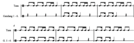
Transkripsi 3.3 Pangka matam lagu siontong tabang berbentuk perpaduan motif ritme dan pola ritme (Asril, 2002: 98)

Pemilihan lagu "Siontong Tabang" sebagai objek kajian struktur lagu didasarkan pada prinsip dari yang sederhana ke yang kompleks. Pada bagian-bagian tertentu, permainan Tasa dan gendang dalam lagu ini memiliki ritme yang sama. Penempatan ritme-ritme Tasa dalam permainan gendang dapat berpedoman pada ciri-ciri tertentu, sehingga mudah dikenali dalam keseluruhan permainan.