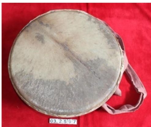
Gambar 4.1 Instrumen Tasa Pada zaman dahulu

(Dokumentasi: Berli, Museum AdityaWarman, 7 juli 2024)