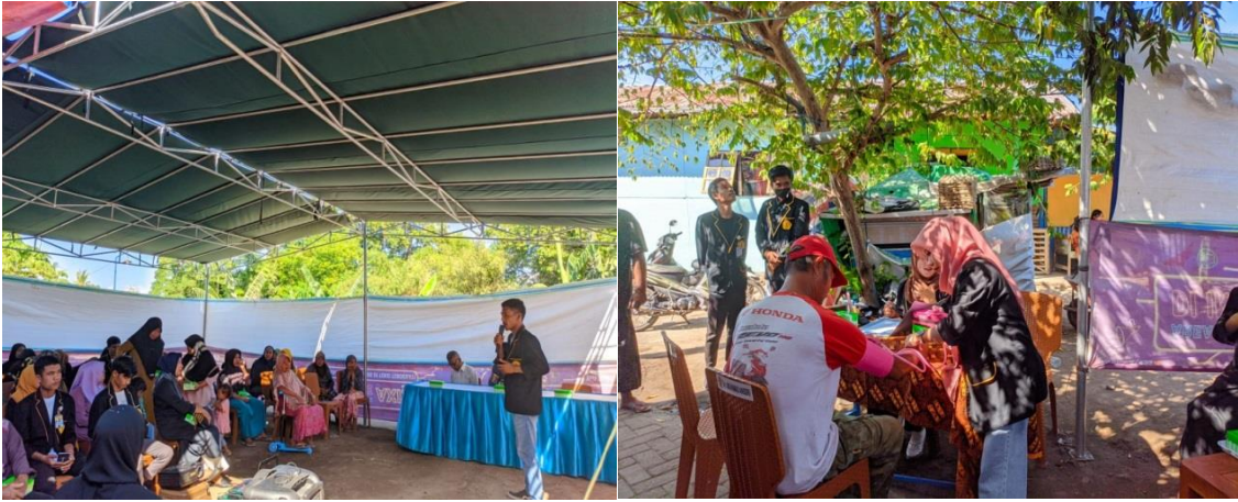
Gambar 1. Dokumentasi Kegiatan Pengabdian Kepada Masyarakat di Kelurahan Bugis Kec. Sumbawa

Posbindu PTM merupakan peran serta masyarakat dalam melakukan kegiatan deteksi dini dan pemantauan faktor risiko PTM Utama yang dilaksanakan secara terpadu, rutin, dan periodik. Faktor risiko penyakit tidak menular (PTM) meliputi merokok, konsumsi minuman beralkohol, pola makan tidak sehat, kurang aktifitas fisik, obesitas, stres, hipertensi, hiperglikemi, hiperkolesterol serta menindak lanjuti secara dini faktor risiko yang ditemukan melalui konseling kesehatan dan segera merujuk ke fasilitas pelayanan kesehatan dasar. Kelompok PTM Utama adalah diabetes melitus (DM), kanker, penyakit jantung dan pembuluh darah (PJPD), penyakit paru obstruktif kronis (PPOK), dan gangguan akibat kecelakaan dan tindak kekerasan (Petunjuk Teknis Kegiatan Posbindu PTM, 2012).