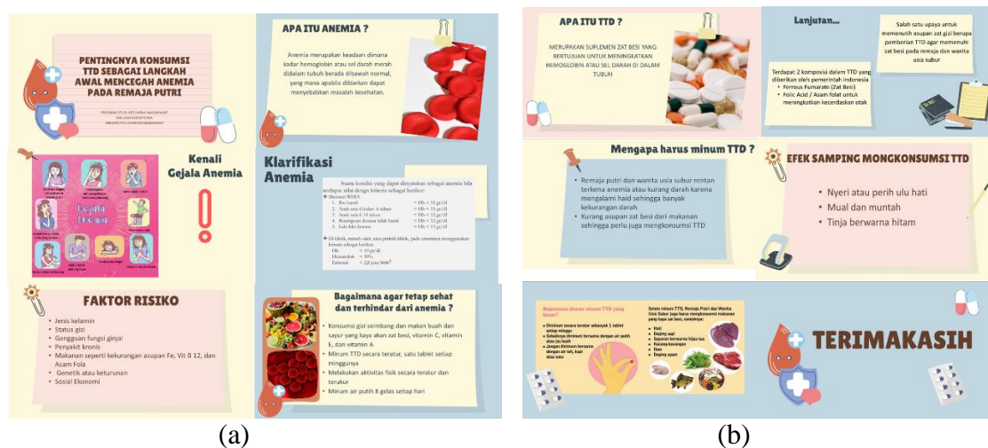
Gambar 2. Materi Penyuluhan mengenai (a) Anemia dan (b) Tablet Tambah Darah (TTD)

Pelaksanaan kegiatan pengabdian dilaksanakan pada 22 Mei 2022. Pada pelaksanaan kegiatan diawali dengan pembukaan dan pemaparan materi dengan metode ceramah menggunakan slide powerpoint mengenai pentingnya dalam mengonsumsi TTD untuk mencegah anemia bagi remaja putri. Materi tersusun mengenai definisi, gejala, klasifikasi dan faktor risiko anemia serta pencegahan dan pengendalian anemia dengan mengonsumsi TTD (Gambar 2).