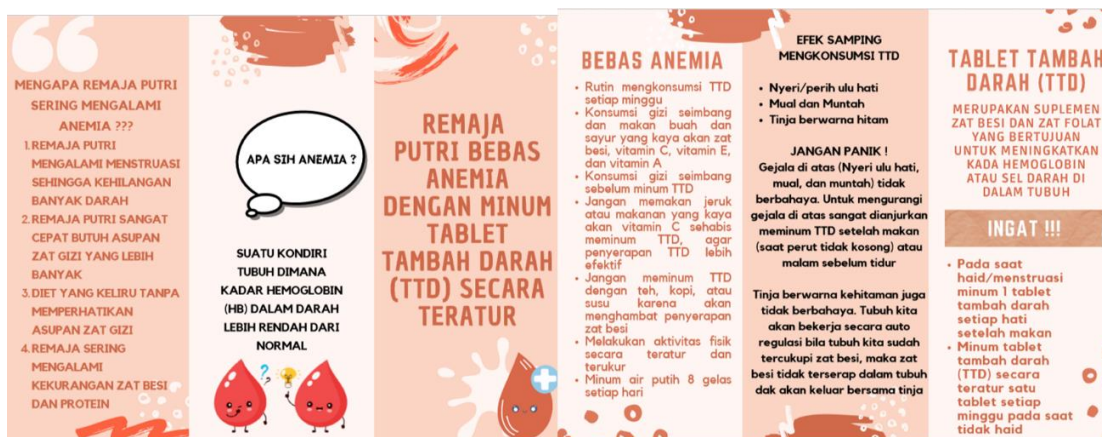
Gambar 4. E-Leaflet

Pada akhir pelaksanaan acara diberikan e-leaflet kepada sasaran (Gambar 4). E-leaflet merupakan. Media penyuluhan digunakan adalah slide powerpoint dan leaflet. Penyuluhan kesehatan dilakukan menggunakan metode ceramah dengan media e-leaflet yang bertujuan untuk memberi pemahaman yang efisien terhadap sasaran karena memberikan ilustrasi berupa gambar dan tulisan mengenai anemia dan TTD. E-leaflet dapat diakses secara digital melalui gadget yang dimiliki oleh sasaran dengan akses terhadap media dapat diakses dimana saja [17].